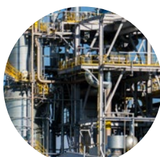
Fábrica de ácido nítrico