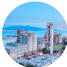
Fábrica de vitriolo