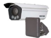
IDS-TCV900 DS-TD10N-1 Punto de comprobación/Radar