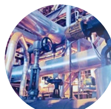
Fábrica de ácido clorhídrico